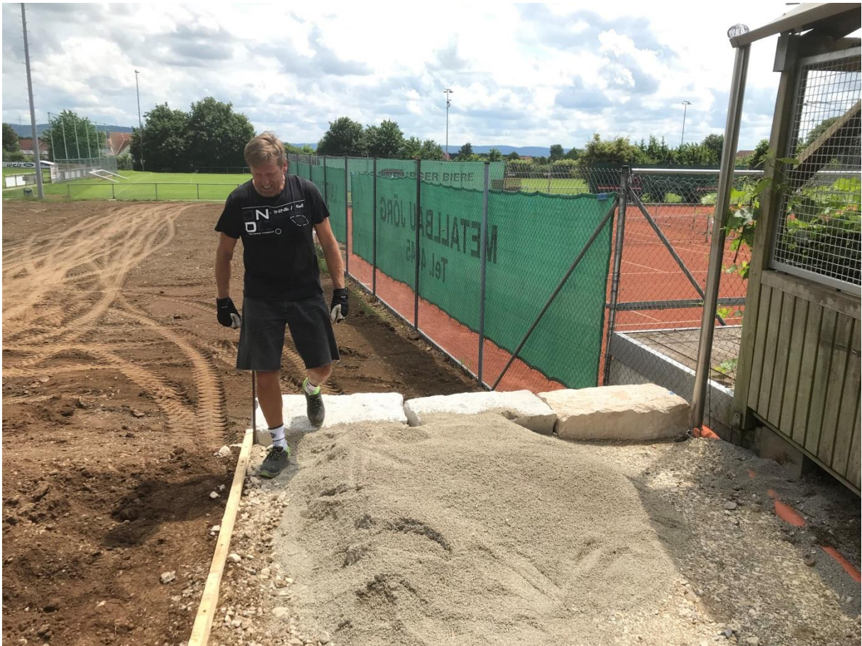
Weiterhin wurde auch das an der Tennishütte neu entstandene Plateau für die Pflasterung vorbereitet