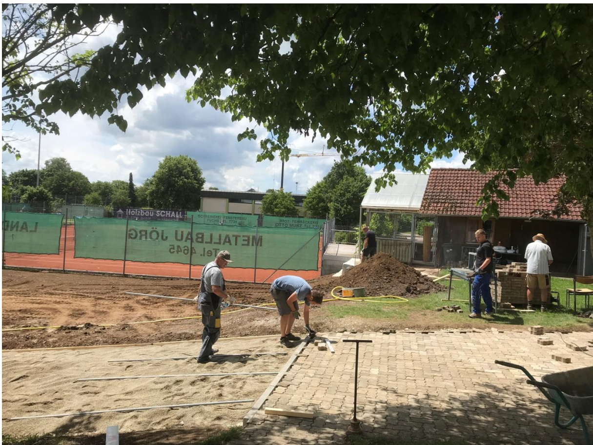
und natürlich gesägt und eingepasst