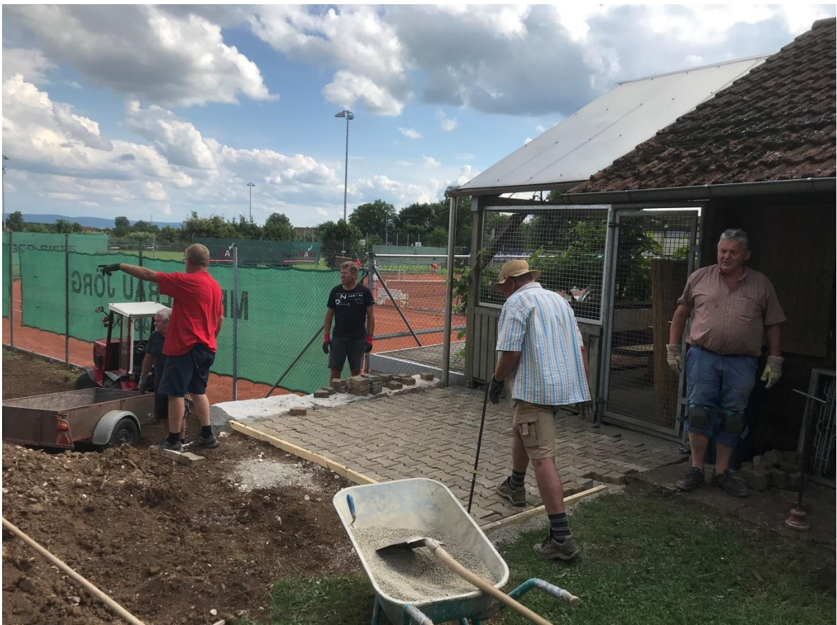
und mit Steinen ausgelegt.