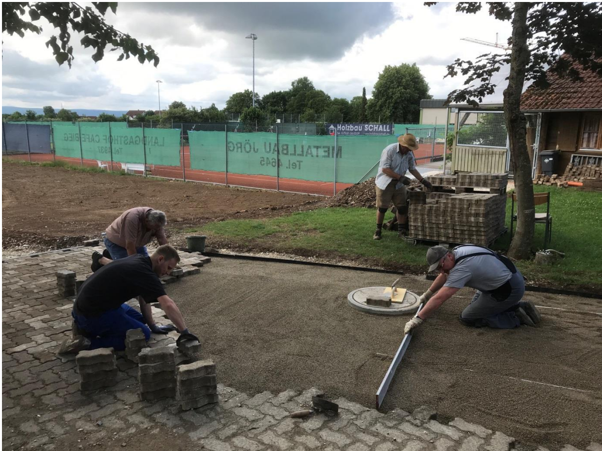
Anschließend wurde dieser fachmännisch abgezogen und die Steine verlegt